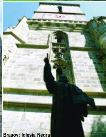
Brasov: Iglesia Negra