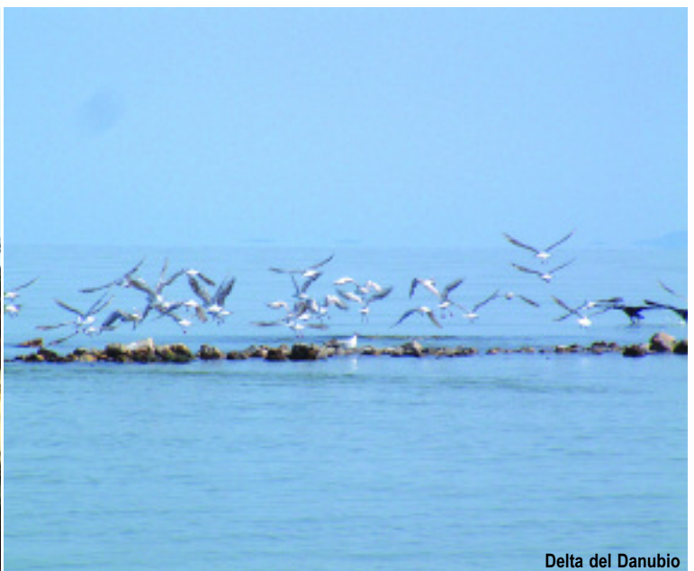
Delta del Danubio