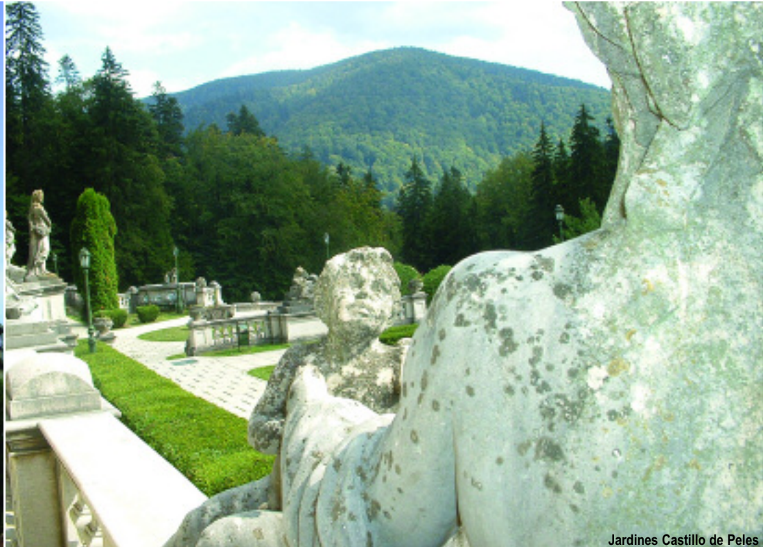
Jardines Castillo de Peles