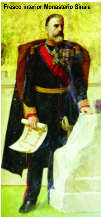
Fresco interior Monasterio Sinaia

11 - BUCAREST - CIUDAD DE ORIGEN Desayuno y traslado (colectivo) al aeropuerto para salir en vuelo de regreso. Llegada y fin del viaje.