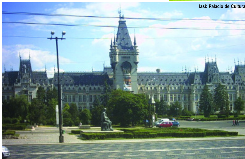
Iasi: Palacio de Cultura