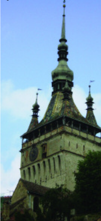
Sighisoara: Torre del Reloj