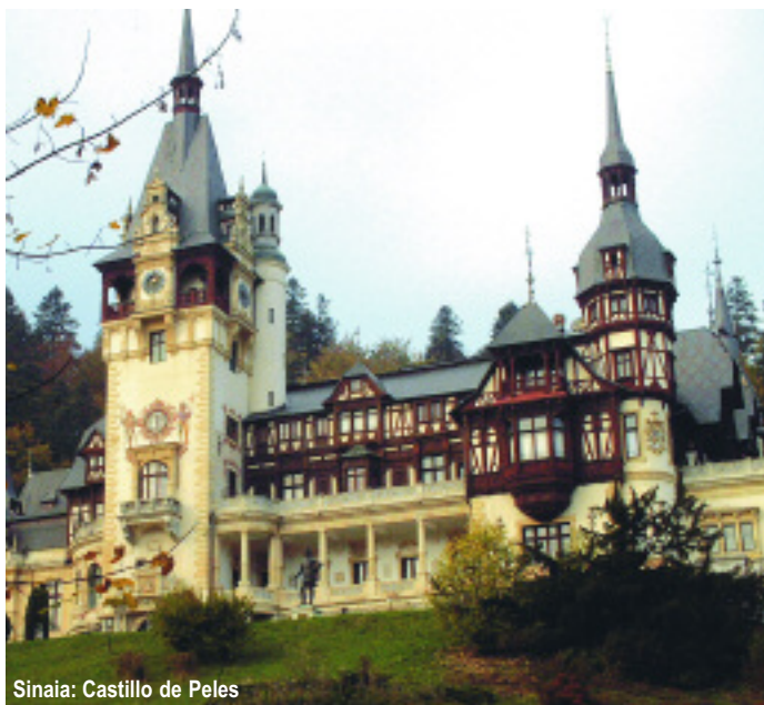
Sinaia: Castillo de Peles

TOUR REGULAR MÍNIMO DE PARTICIPANTES: 10 personas